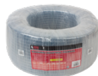
EMPAQUE MIN: 1